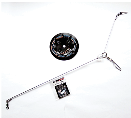
スーパーランナー天秤と専用クッションリーダー

大型青物用天秤のニューフェイス「スーパーランナー天秤」は、ご使用にあたってのリーダーと仕掛との接続を以下の要領で行っていただけますと、最大限のパフォーマンスが発揮できます。