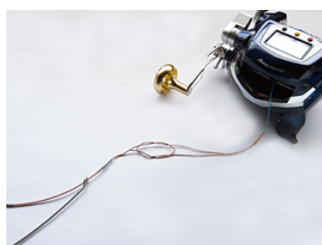
道糸(リール)側の接続